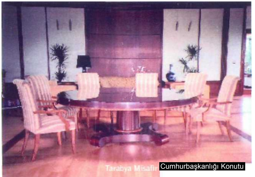
Tarabya Mısafiri Cumhurbaşkanlığı Konutu

Yukarıda bahsettiğim bu iki düşünceyi, ekolü biraz daha anlatmak için şöyle bir misal verebilirim; Okulda olduğumuz 1965'li yıllarda, Güzel Sanatlar Akademisi'yle bizim Tatbiki Güzel Sanatlar Yüksekokulu arasında "Biz, 'Sanat Toplum İçindir' felsefesinde olan ve genelde tasarımları çok uygulanan taraf idik. Onlar ise tasarımları çok beğenilen ancak uygulanabilirliği çok olmayan taraf idi" gibi bîr düşüncelerle özellikle Mobilya ve iç mimari bölümleri arasında tatlı bir rekabet vardı.